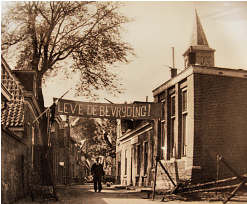
De Molenstraat in Den Burg met een nog niet opgeruimde wegversperring na de bevrijding. De kerk op de achtergrond is de rooms-katholieke kerk.

Toen de rust langzaam weerkeerde, zetten de overlevende Georgiërs alles op alles om bij het verzet en de communistische partij op papier te krijgen dat zij zich dapper hadden verzet tegen de Duitsers. Bij terugkeer in de Sovjet-Unie konden dergelijke verklaringen