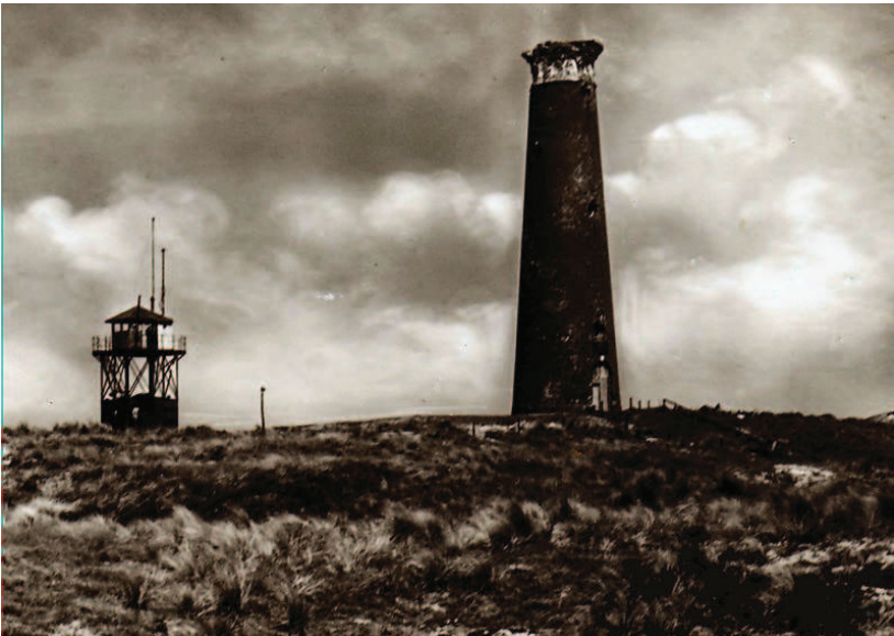
De Eierlandse vuurtoren tussen april 1945 en 1950. Toen de Georgiërs zich hier verschansten, namen de Duitsers de toren onder vuur. De muur en de lichtinstallatie raakten hierbij zwaar beschadigd.

Het schriftelijke verzoek tot militaire hulp dat ze bij zich hadden werd via Scotland Yard overhandigd aan de Nederlandse en