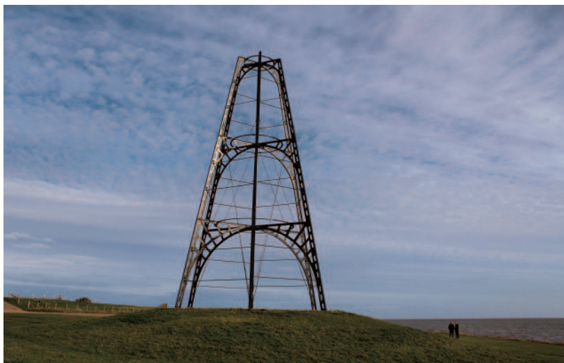
De vijftien meter hoge IJzeren Kaap uit 1854 vormde samen met de toren van de Hervormde Kerk in Oosterend een bakenlijn voor de scheepvaart op de Texelstroom.

De IJzeren Kaap is een zogenaamd vuurloos baken, dat alleen overdag gebruikt kon worden. Hij is ongeveer vijftien meter hoog en bestaat uit vier etages, waarvan er een bij verzwaring van de Waddendijk en herplaatsing eind jaren zeventig van de twintigste eeuw onder de grond is komen te liggen.